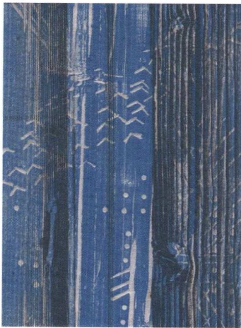
Claire Nicole, bois gravé, 2013 H. 96/ L. 12 cm (détail)

NOURRI DE RENCONTRES et d'échanges entre écrivains et plasticiens, le livre d'artiste connaît dans le paysage de la création contemporaine un essor certain, à la faveur de la liberté extrême qui le caractérise. La triennale Tirage limité souhaite sensibiliser le public à ce mode d'expression particulier et mettre en valeur le travail de création de plasticiens et éditeurs romands. Pour sa 3e édition, en plus de présenter une trentaine d'exposants romands, les organisateurs ont appelé «les Bretons à la rescousse», une carte blanche à six éditeurs et créateurs.